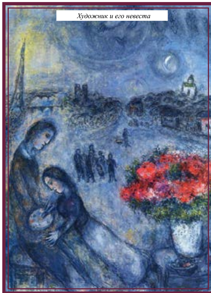
Художник и его невеста

распятие» художник использовал национальные мотивы и аллегии, внутренне предчувствуя будущий холокост.