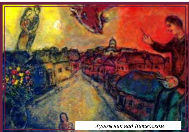
Художник над Витебском

с ее сквозными для всего шагаловского творчества безумными образами клоунов, арлекинов и акробатов. По приказу министра пропаганды фашистской Германии Йозефа Геббельса в 1933 году произведения мастера были публично сожжены в Мангейме. Гонения на евреев в фашистской Германии, предчувствие окрасили произведения Марка Шагала в апокалиптические тона. В 1941 году по приглашению руководства Музея современного искусства живописец переехал в Нью-Йорк. В предвоенные и военные годы одной из ведущих тем искусства Шагала стало распятие. В картине «Белое