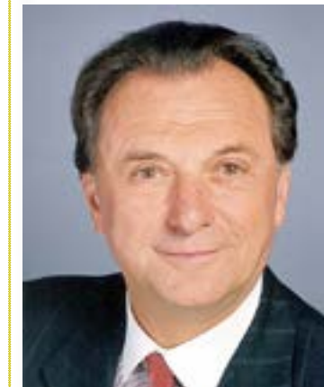
Чарльз Дэвид Кельман (Charles David Kelman, 1930 –2004)

Многогранная личность и неординарная судьба Кельмана заслуживают внимания. Он стал автором 126 патентов в области офтальмологии и вошёл в список десяти самых выдающихся офтальмологов XX века Американской академии офтальмологии.